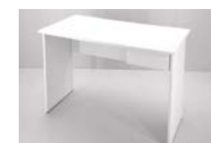
ESCRITORIO MELAMINA (1.20X0,60) Valor: $ 115.000 (*)