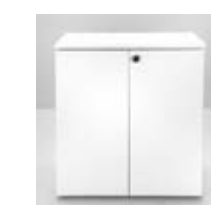
MOSTRADOR GUARDADO (1X0,5X1,05) Valor: $ 207.000 (*)