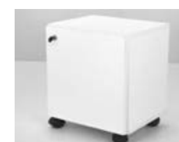
GUARDADO CHICO MELAMINA Valor: $ 58.000 (*)