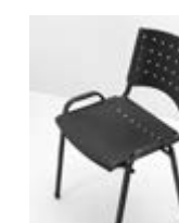
SILLA BRAZO CON METAL Valor: $ 64.000 (*)