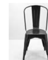
SILLA TOLIX METAL Valor: $ 58.000 (*)