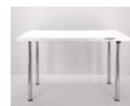
MESA REUNION MELAMINA Valor: $ 211.000 (*)