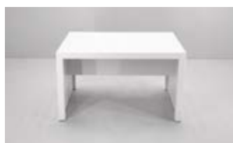
MESA RATONA MELAMINA Valor: $ 127.000(*)