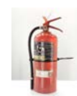
MATAFUEGO 5 kg ABC Valor: $ 96.000 (*)