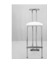
TABURETE TEMPO METAL Valor: $ 69.000 (*)

FORMA DE PAGO: 50% Pago al momento de la contratación y 50% antes del 15 de enero de 2025. (*) Los importes son en pesos argentinos. No incluye IVA (21%) y otros impuestos. (Los mismos serán adicionados en la Factura según corresponda) FECHA LÍMITE PARA CONTRATACIÓN: 15 de enero 2025 o hasta agotar stock