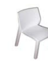
SILLA PARIS PLASTICA Valor: $ 35.000 (*)