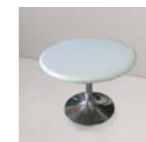
MESA BAJA METAL Valor: $ 69.000 (*)