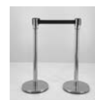
UNIFILA METAL Valor: $ 62.000 (*)