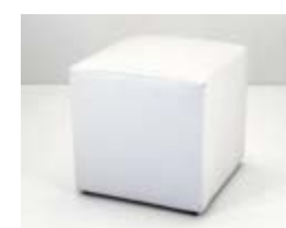
PUFF 50X50 ECOCUERO Valor: $ 33.000 (*)