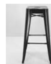
TABURETE TOLIX Valor: $ 77.000 (*)