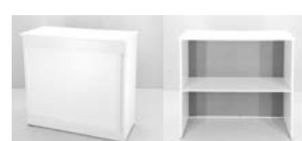
MOSTRADOR MELAMINA (1X0,5X1,05) Valor: $ 173.000 (*)