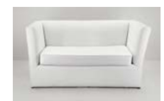
SILLON VALENCIA DOBLE ECOCUERO Valor: $ 375.000 (*)