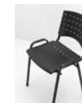
SILLA LISI PLASTICA Valor: $ 35.000 (*)