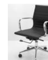
SILLA ALUMINIUM METAL Valor: $ 134.000 (*)