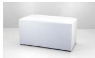
PUFF DOBLE ECOCUERO Valor: $ 54.000 (*)