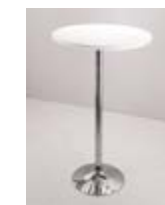
MESA ALTA METAL Valor: $ 85.000 (*)