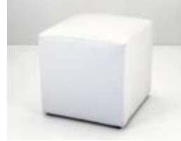
PUFF 50X50 ECOCUERO Valor: $ 33.000 (*)