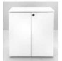
MOSTRADOR GUARDADO (1X0,5X1,05) Valor: $ 207.000 (*)