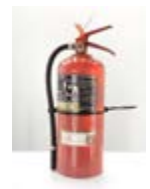
MATAFUEGO 5 kg ABC Valor: $ 96.000 (*)