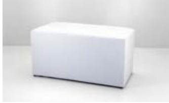
PUFF DOBLE ECOCUERO Valor: $ 54.000 (*)