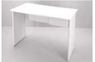
ESCRITORIO MELAMINA (1.20X0,60) Valor: $ 115.000 (*)