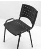
SILLA BRAZO CON METAL Valor: $ 64.000 (*)