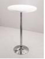
MESA ALTA METAL Valor: $ 85.000 (*)