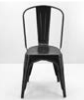
SILLA TOLIX METAL Valor: $ 58.000 (*)