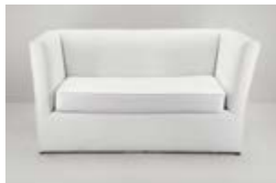
SILLON VALENCIA DOBLE ECOCUERO Valor: $ 375.000 (*)