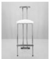
TABURETE TEMPO METAL Valor: $ 69.000 (*)

FORMA DE PAGO: 50% Pago al momento de la contratación y 50% antes del 15 de enero de 2025. (*) Los importes son en pesos argentinos. No incluye IVA (21%) y otros impuestos. (Los mismos serán adicionados en la Factura según corresponda) FECHA LÍMITE PARA CONTRATACIÓN: 15 de enero 2025 o hasta agotar stock