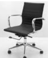
SILLA ALUMINIUM METAL Valor: $ 134.000 (*)