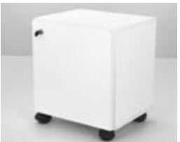
GUARDADO CHICO MELAMINA Valor: $ 58.000 (*)