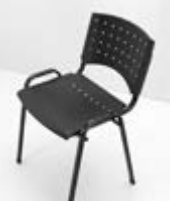
SILLA LISI PLASTICA Valor: $ 35.000 (*)