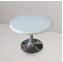
MESA BAJA METAL Valor: $ 69.000 (*)