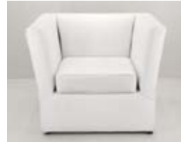
SILLON VALENCIA ECOCUERO Valor: $ 173.000 (*)