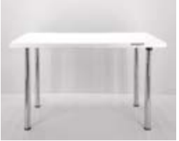
MESA REUNION MELAMINA Valor: $ 211.000 (*)