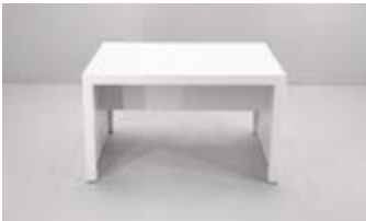
MESA RATONA MELAMINA Valor: $ 127.000(*)