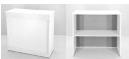
MOSTRADOR MELAMINA (1X0,5X1,05) Valor: $ 173.000 (*)