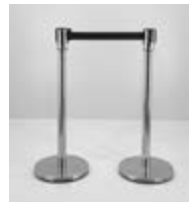
UNIFILA METAL Valor: $ 62.000 (*)