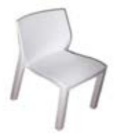
SILLA PARIS PLASTICA Valor: $ 35.000 (*)