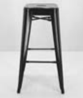
TABURETE TOLIX Valor: $ 77.000 (*)